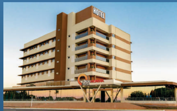
Hotel Orla Morena Park Hotel Av. Duque de Caxias, 2100 (67) 3212-5298