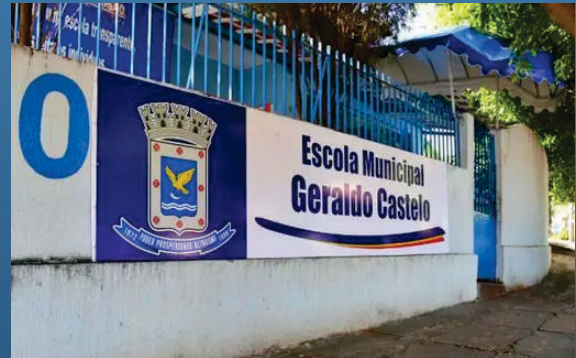
Escola M. Geraldo Castelo R. Padre João Crippa, 218 (67) 2020-2398