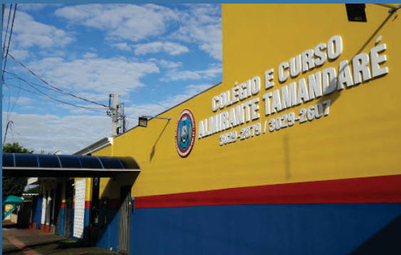
CCAT- Colégio e Curso Almirante Tamandaré R. Gen. Nepomuceno Costa, 493 (67) 3029-2879