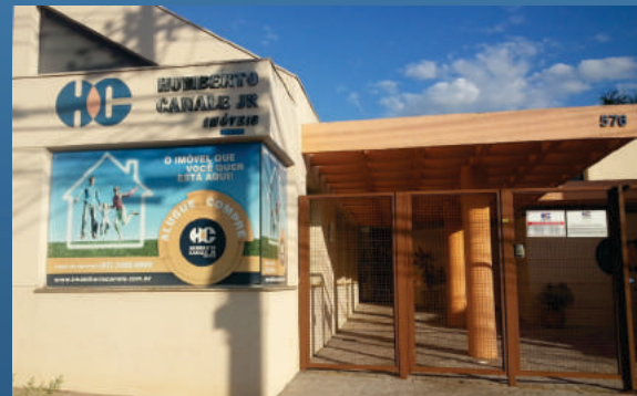
Humberto Canale Jr. Imóveis R. Euclídes da Cunha, 576 (67) 3382-6060