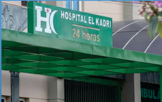
Hospital El Kadri R. Dr. Arthur Jorge, 295 (67) 3041-5050