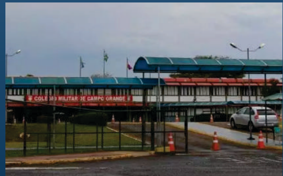
Colégio Militar de Campo Grande Av. Pres. Vargas, 2800 (67) 3368-4820