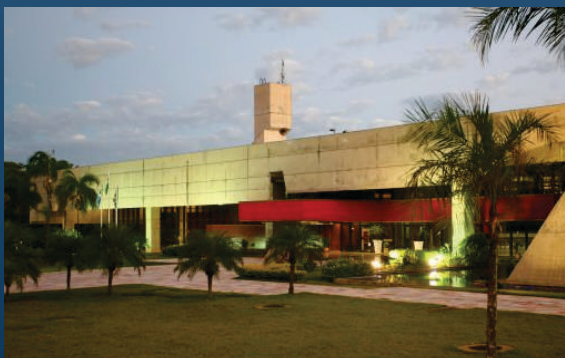
Centro de Convenções Rubens Gil de Camillo Av. Waldir dos Santos Pereira, s/n Parque dos Poderes