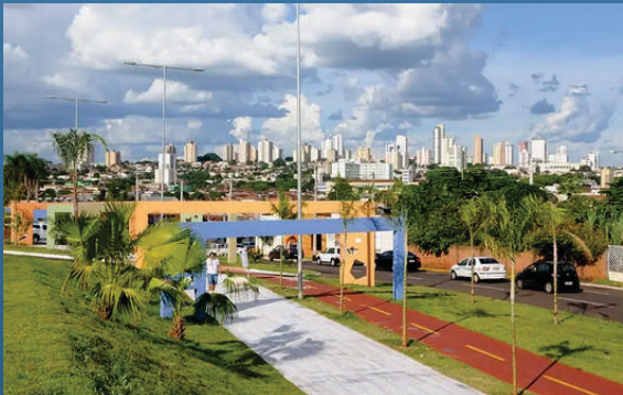
Orla Morena Av. Noroeste, 2210