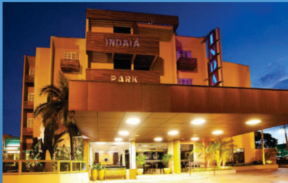
Indaiá Park Hotel Av. Afonso Pena, 354 (67) 2106-1000