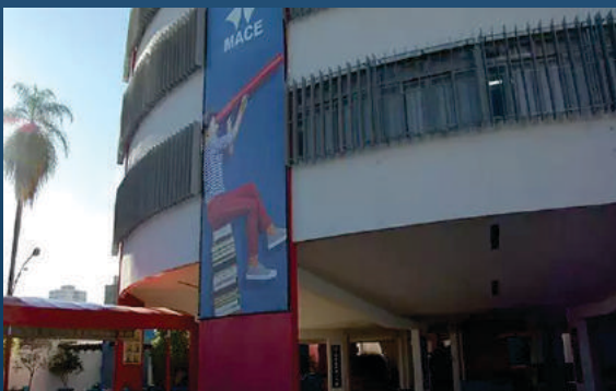
Elite Rede de Ensino - MACE Rua 26 de Agosto, 63 (67) 3316-3600