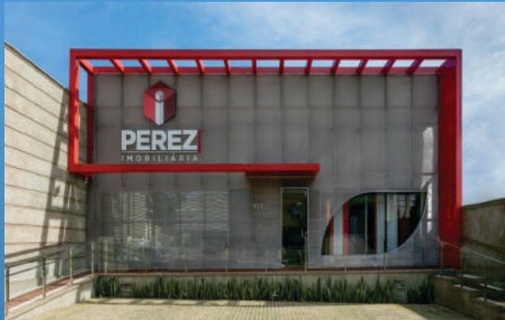
Perez Imóveis R. Espírito Santo, 911 (67) 3324-1040