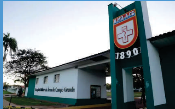
Hospital Militar de Área de Campo Grande Av. Duque de Caxias, 474 (67) 3368-4322