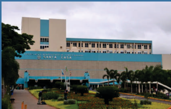
Santa Casa de Campo Grande R. Eduardo Santos Pereira, 88 (67) 3322-4000