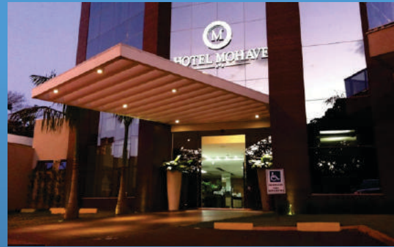
Hotel Mohave Av. Afonso Pena, 602 (67) 3306-7743