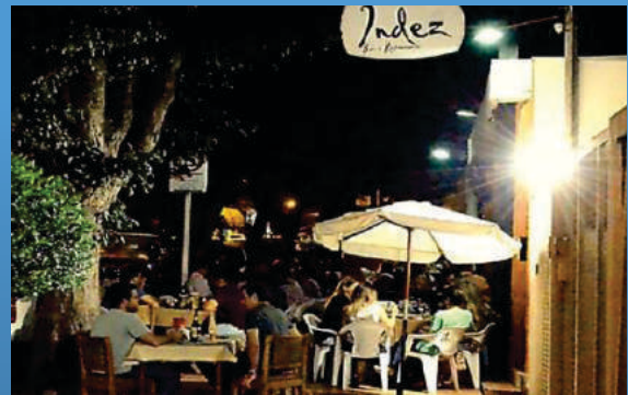
Indez Bar e Restaurante

Rua 15 de Novembro, 1064 Fone:67 3384-9622