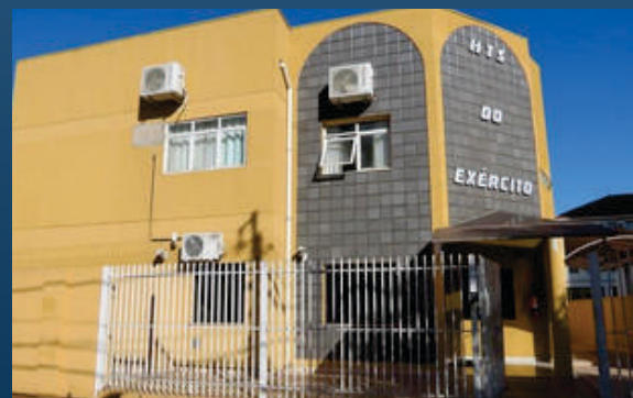
Hotel De Trânsito De Oficiais e ST/Sgt Av. Afonso Pena, 2263 (67) 3321-1442