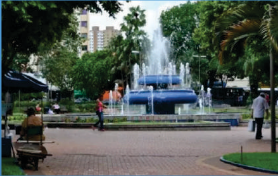
Praça Ary Coelho Rua 14 de Julho - Centro