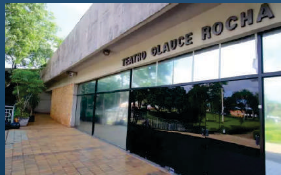
Teatro Glauce Rocha R. Ufms, S/N