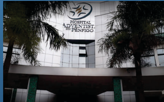
Hospital Adventista do Penfigo Unidade Centro R. Barão do Rio Branco, 2590 (67) 3323-2100