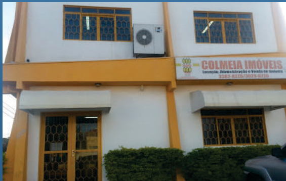
Colmeia Corretora de Imóveis R. Pedro Celestino, 409 (67) 3382-0226