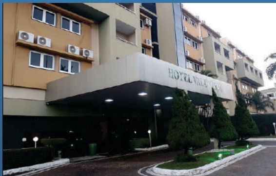
Hotel Vale Verde Av. Afonso Pena, 106 (67) 3041-3355