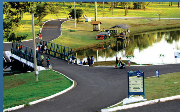
Parque das Nações Indígenas Av. Afonso Pena