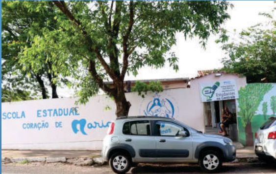
Escola E. Coração de Maria R. Dr. Aníbal de Tolêdo, 420 (67) 3314-5630