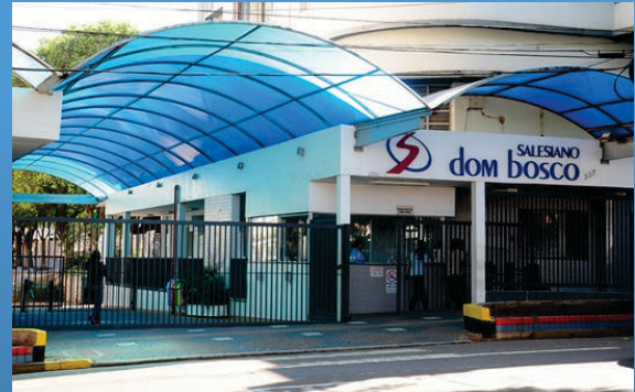
Colégio Salesiano Dom Bosco Av. Mato Grosso, 227 (67) 3312-3200