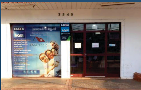
JK Stefanini Negócios Imobiliários Av. Júlio de Castilho, 3549 (67) 3028-7979