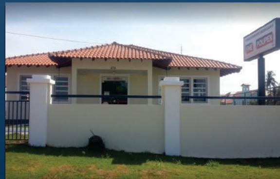
Poupex Av Duque de Caxias, 474 (67) 2106-8260