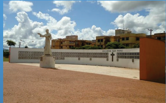
Praça do Papa Av. dos Crisântemos, 457